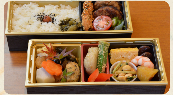
和牛 | 00%ハンバーグ