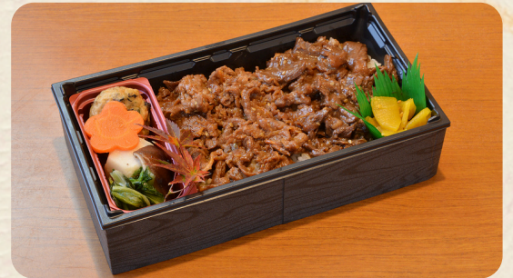
国産黒毛和牛焼肉重