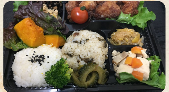
DX幕の内唐揚げ弁当